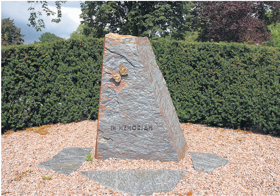
De herdenkingsplaats is om even stil te staan temidden van de jachtige samenleving.

waarop een gezin twee keer de dochtertjes en zusjes Beppie herdenkt; de eerste Beppie leefde van augustus 1939 tot januari 1940 en de tweede van 16 mei 1940 tot 29 maart 1944. Kennelijk kreeg de tweede